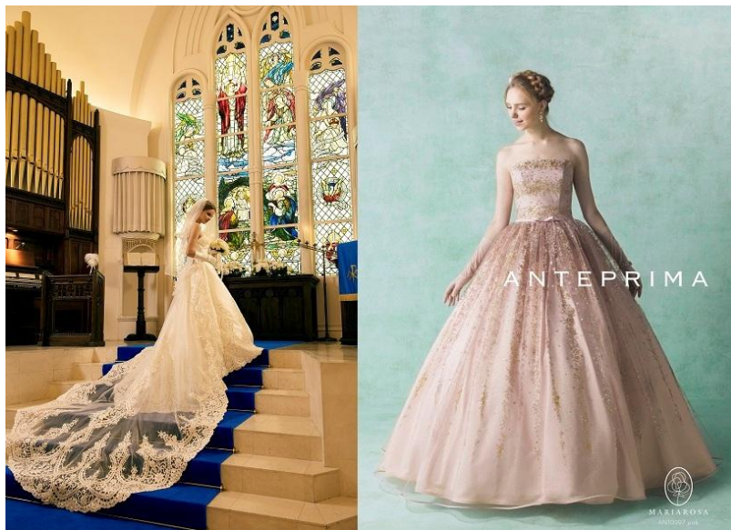
<ドレスショー登場ドレスイメージ> 写真左:TAKAMI BRIDAL 写真右:フォーシス アンド カンパニー