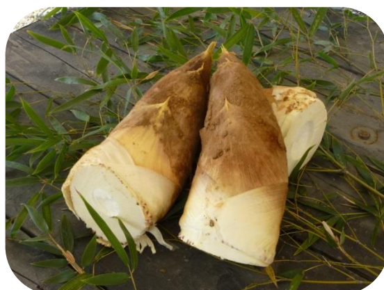
【京阪】八幡のうまいもん・たけのこ