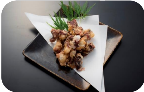
たこの唐揚げ (イベント限定)

当日限定のメニューを含めた「うまいもん祭」特別メニュー等を300円から販売します。