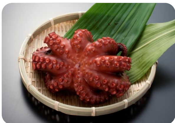
【南海】田尻のうまいもん・泉だこ