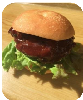
たけのこバーガー

八幡産・山城産のたけのこ、新鮮な野菜や紅茶のほか、たけのこご飯やたけのこバーガーを販売します。