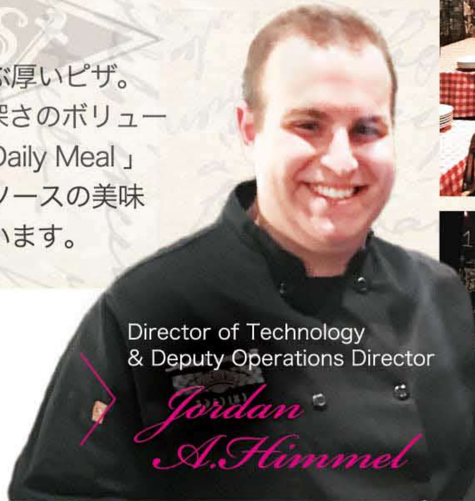
Director of Technology & Deputy Operations Director

GINO'S EAST 162 E Superior St. Chicago, IL Phone (312)266-3337 http://www.ginoseast.com/