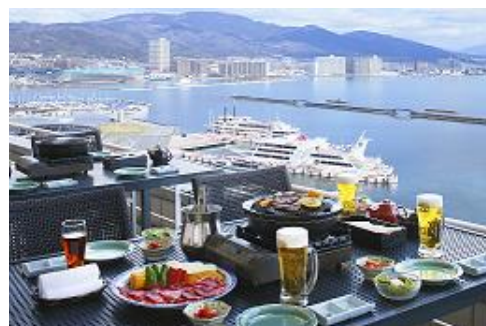
▲「屋上アウトドアバーベキュー星」イメージ