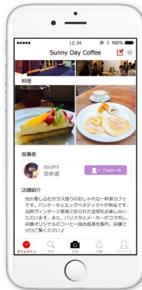
<カフェ推薦者を紹介>

本件に関する報道機関からのお問い合わせ先: 株式会社オールアバウト PR担当: 大貫