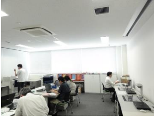
独立したオフィス (人事部と共有)