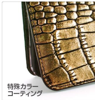
特殊カラー コーティング