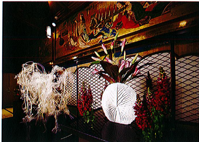
▲展示イメージ(漁樵の間)

目黒雅叙園(運営:株式会社 目黒雅叙園/所在地:東京都目黒区)では、2016年3月15日(火)から5月15日(日)まで、「いけばな×百段階段2016」を、園内・東京都指定有形文化財「百段階段」にて開催しております。日本最大のいけばな団体・公益財団法人日本いけばな芸術協会から51もの流派が集う本展は、過去3回の開催で、延べ13万6千人の来場者数を記録した東京の春を代表するイベントとなっております。会場となる「百段階段」は昭和初期に著名な画家たちによって描かれた日本画と意匠が凝らされた装飾が施された文化財。昭和を代表する日本画家たちと日本を代表するいけばな流派による共演は本展覧会でしか見ることができない貴重な空間です。美術品である空間を最大限に活かした、本展ならではのいけばなをお楽しみください。