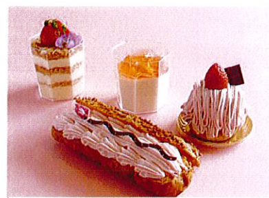
(前) エクレアサクラ (右) 苺モンブラン (中央) 杏仁豆腐 桜ジュレ (左) 苺ミルフィーユ