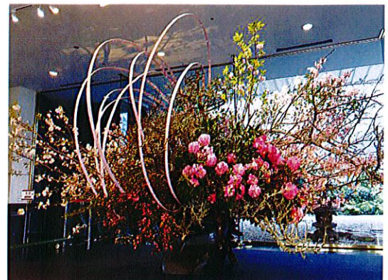
▲展示イメージ(エントランスロビー)