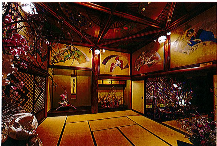
▲展示イメージ(清方の間)