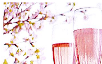
ロゼスパークリングワインイメージ

《本内容・取材に関する お問い合わせ》 (株)トランスミッション (TEL: 03-6802-8048 / FAX:03-6802-8239) 大金(090-3563-5894) oogane@bc.ij4u.or.jp