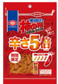
『60g 亀田の柿の種辛さ5倍』

お客様からの、“もっと辛い「亀田の柿の種」を食べてみたい！”の声にお応えし、2014年・2015年と、期間限定で『亀田の柿の種 辛さ5倍』を販売。大変ご好評をいただきましたが、「もっと辛くして欲しい！」「まだまだ足りない」というご意見も頂戴し、この度辛さ5倍をさらに上回る・・・驚きの“7倍”を販売いたします。