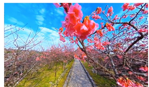
<沖縄県・今帰仁城跡>

沖縄県の今帰仁城跡は、桜の名所の中でも最南端に位置する桜の絶景スポットのひとつ。本州などでよく見られるソメイヨシノとは異なり、しっかりと色づいた濃いピンク色が印象的な寒緋桜(カンヒザクラ)が有名です。比較的低木で下向きに花が咲くのも特徴で、“金麦特等席”でも見上げれば青空とピンクの色鮮やかなコントラストが愉しめます。世界遺産にも認定されている今帰仁城の風景とともに、趣深い桜の絶景をお愉しみください。