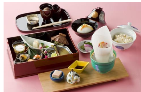
日本料理 渡風亭「雛会席膳」(イメージ)