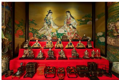
▲丹野家の雛人形(岩手)