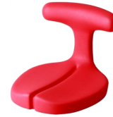
ayur medical seat