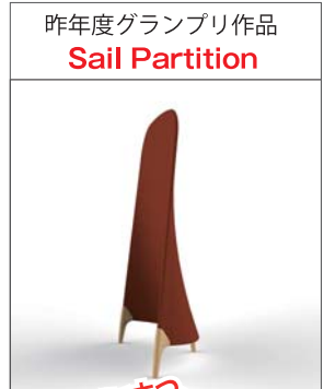
昨年度グランプリ作品 Sail Partition

あらゆるデザインコンペで役に立つ、 入賞するためのヒントが満載です! コンペに応募しない方も臨場感あふれる 審査会をぜひご覧ください! 大ヒット商品誕生の瞬間に立ち会えるかも!?