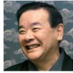
千 宗守 茶道 武者小路千家 官休庵 第十四代家元 不徹斎