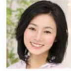
久保 美智代 アナウンサー 旅する世界遺産研究家