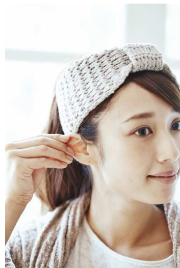
セルフケアの一例：耳のマッサージ