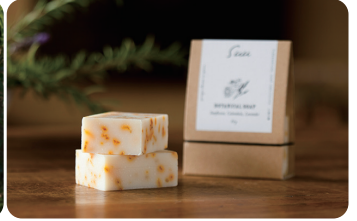
Suu BOTANICAL SOAP ひまわり、カレンデュラ、ラベンダーをとじこめた石鹸