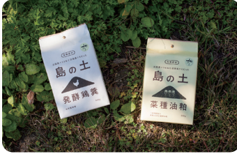
島の土 淡路島でうまれて淡路島でそだった有機肥料