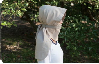
こかげ帽 淡路島の風景の一部となっていく農作業帽