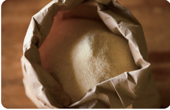
淡路島産デュラム小麦のセモリナ粉 国産のデュラム小麦を粗挽きした小麦粉