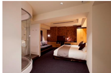
ラギットツイン(1室)