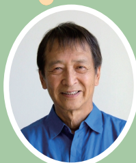
造形作家 新宮 晋氏