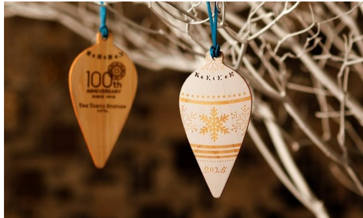
100 周年限定クリスマスチャリティオーナメント

2015年11月2日（月）にホテル開業 100 周年を迎えた東京ステーションホテル（所在地：東京都千代田区丸の内1-9-1）では、100 周年記念プロモーションの締めくくりとして、 森林保全団体「more trees (モア・トゥリーズ)」とコラボレーションしたチャリティ活動を実施します。 12月1日（火）から12月25日（金）のクリスマス期間、国産の間伐材を使ったホテルオリジナルデザインの100周年限定クリスマスチャリティオーナメント(1個1,000円)を販売。売り上げの一部は「more trees」に寄付され、日本の森づくりに活用されます。