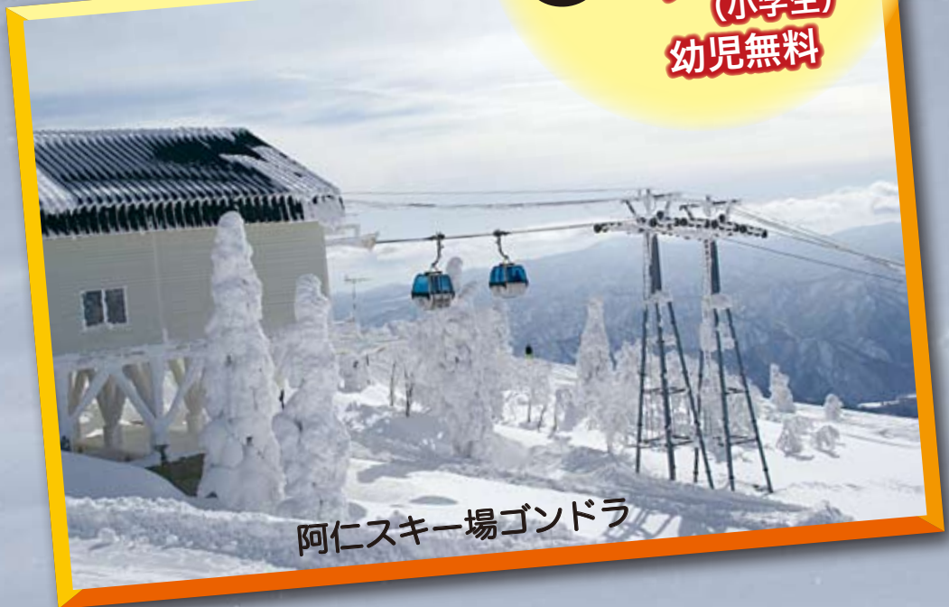
阿仁スキー場ゴンドラ

1枚 大人 4,800円 (中学生以上) 小人 2,400円 (小学生) 幼児無料