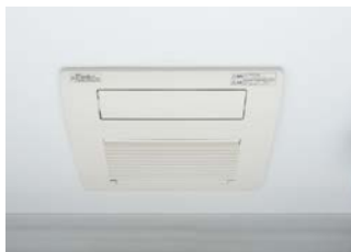
＜TES式浴室暖房乾燥機＞