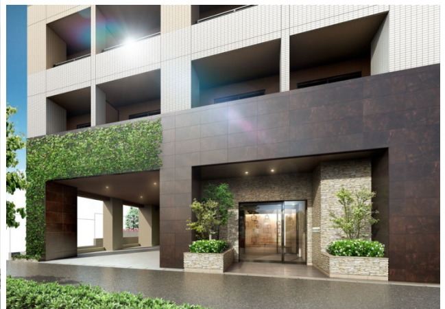
左:外観イメージ、右上:エントランスホールイメージ 右下:エントランスイメージ