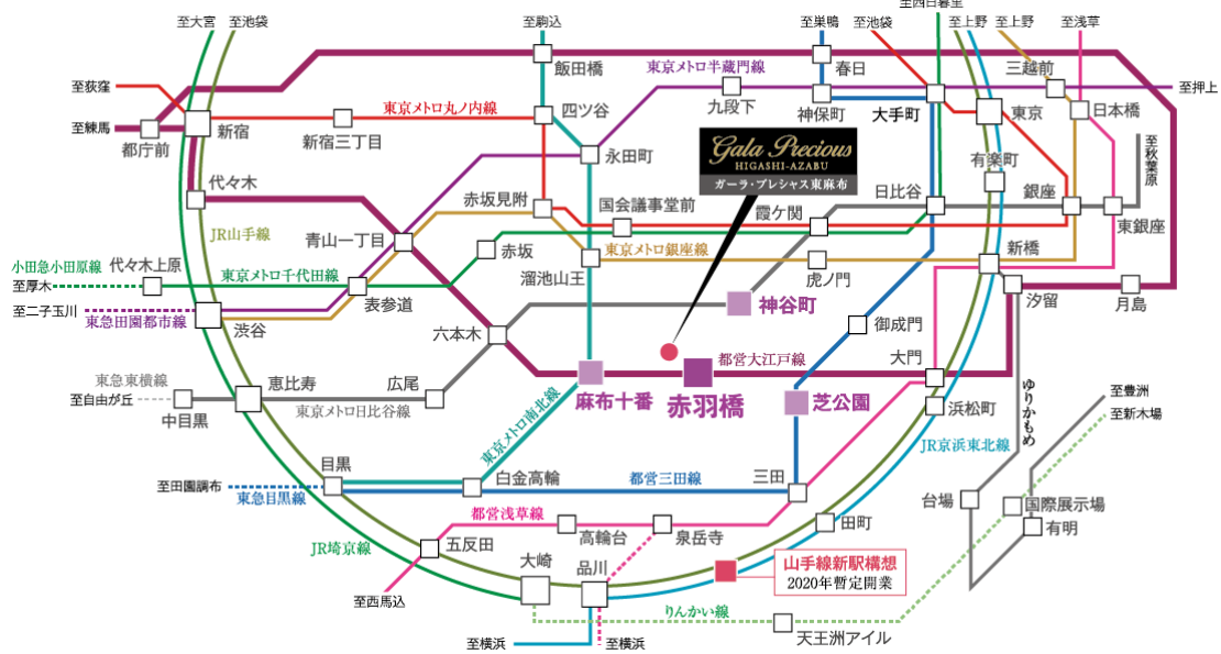
※上記の所要時間は乗換え時間・待ち時間は含まれておりません。また、曜日・時間帯により異なります。

都営大江戸線「赤羽橋」駅から「汐留」へ直通で4分、都営大江戸線、東京メトロ南北線「麻布十番」駅より「六本木」へ直通2分、「虎ノ門」「表参道」「渋谷」へそれぞれ10分以内でアクセスできる利便性の高い立地で、本プロジェクト1km圏内には「東京タワー」「芝公園」、2km圏内には「六本木ヒルズ」「東京ミッドタウン」「汐留シオサイト」「虎ノ門ヒルズ」など、周辺に話題のスポットが点在しております。