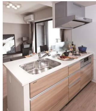
＜システムキッチン＞