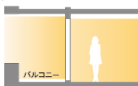
＜逆梁アウトフレームイメージ図＞