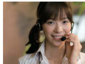
＜ガーラコンシェルジュサービスイメージ＞