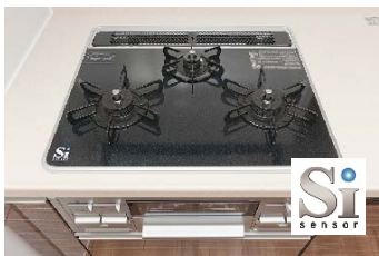
＜Siセンサー付3口ガスコンロ＞