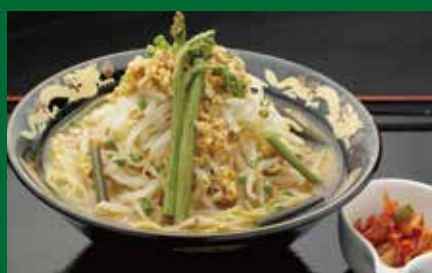
西和賀まるごとラーメン 850円(税込)