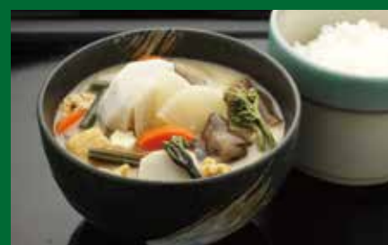
食べる納豆汁セット 500円(税込)

メニュー例 (写真はイメージです。メニュー内容等は予告なく変更となる場合があります。)