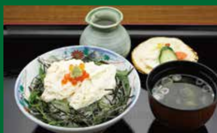
とうふや源助のくみあげゆば丼 850円(税込)