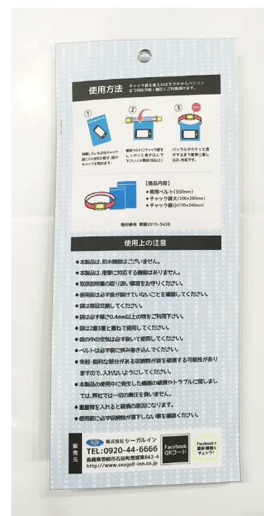
■包装イメージ(裏面)