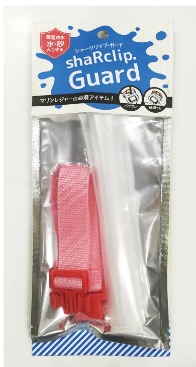
■包装イメージ(表面)