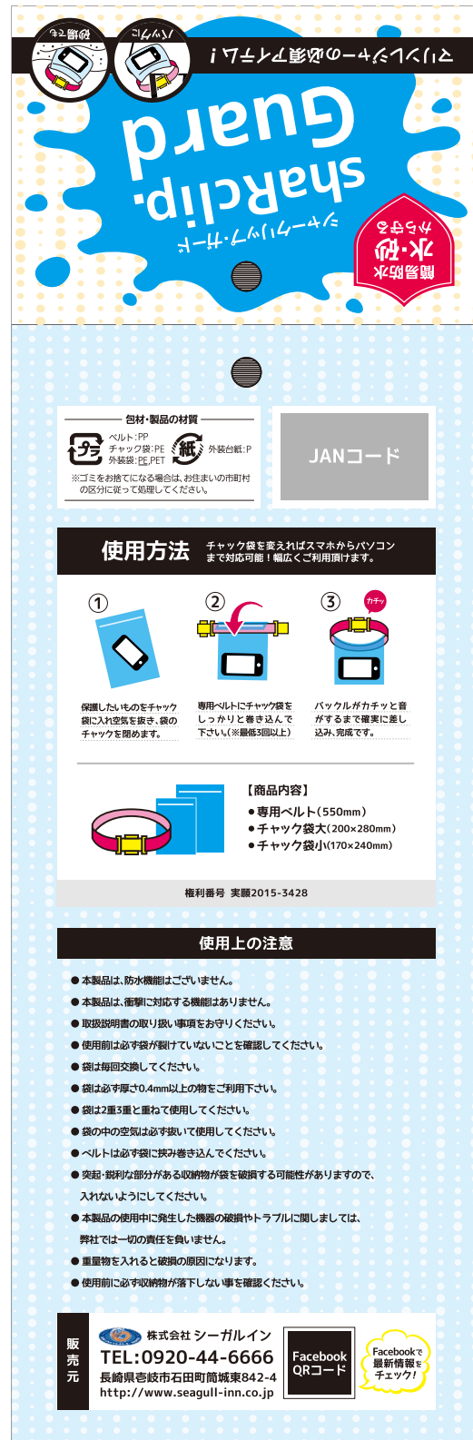
■台紙デザイン(外面) 115×353mm

海・砂浜・水をイメージしたイラストや背景を用いる事で使用シーン(マリンレジャー)を連想させるパッケージを目指しました。 また、上部にフック掛け用の穴をつける事で、陳列場所を選ばないパッケージに。 袋には表が透明、裏がシルバー袋を使用し、よりスタイリッシュなデザインに仕上げています。