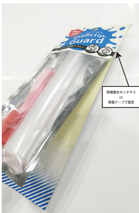
■包装イメージ(側面)