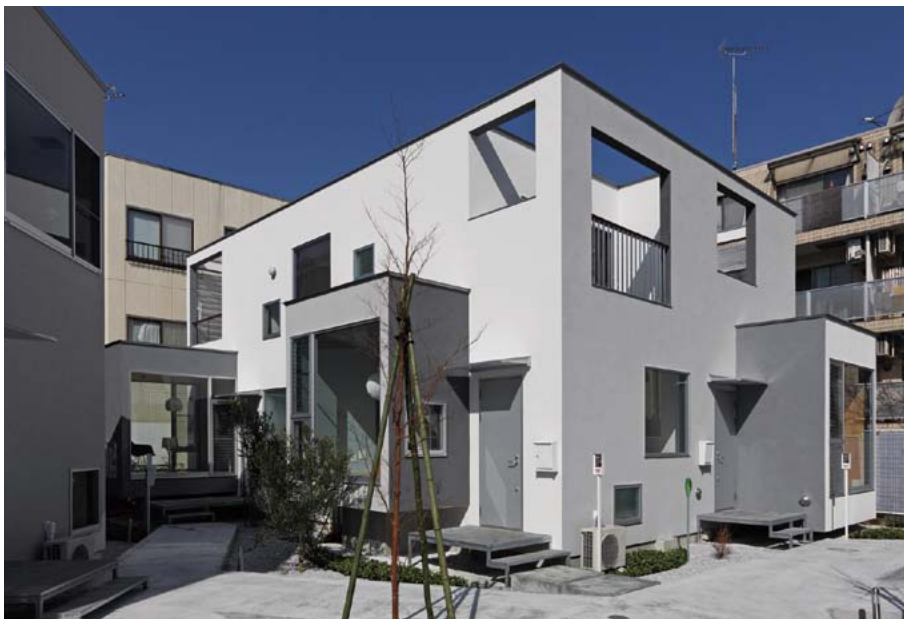
各住戸から引き出しのように飛び出しているのが「アルコーブ」。外観にほど良いアクセントを与えています。夜は、大きな開口部から美しく光が漏れます