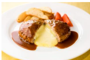
①チーズINハンバーグ