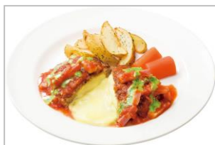
②ベーコンとトマトの イタリアンチーズ IN ハンバーグ