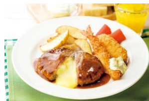
③チーズINハンバーグ&ミックスフライ