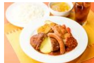
④チーズ IN ミックスグリル