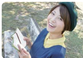
中村 優 タレント