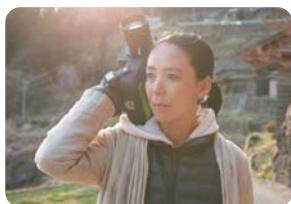
河瀬 直美 映画作家