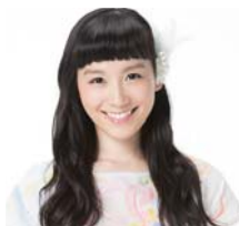
篠原 ともえ アーティスト