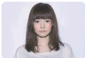
SHIGAMIKI イラストレーター