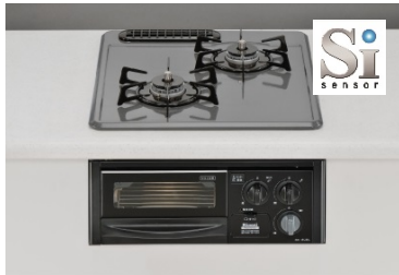
<Siセンサー付2口ガスコンロ>