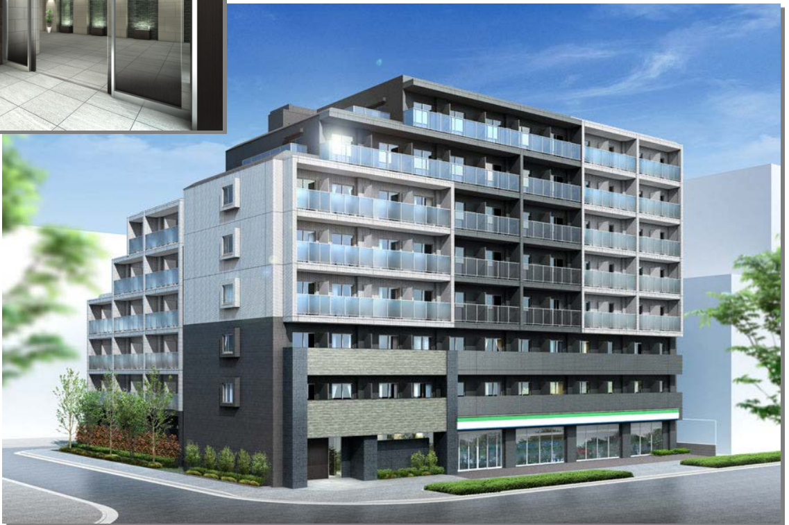
左上:エントランスホールイメージ、右下:外観イメージ