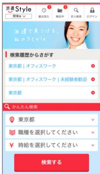
スマートデバイス

「派遣で働くライフスタイル」を応援し、豊富な求人件数に加え、求職者が「選びやすく、探しやすい」機能を提供しております。