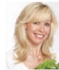
エリカ・アンギャル