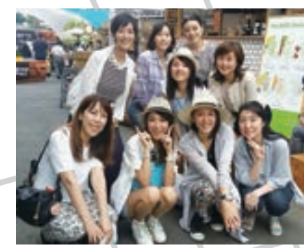
HBAメンバーで表参道を散策し、隠れたナチュラルショップを多数発掘!

表参道は、ラグジュアリーブランドが立ち並ぶハイファッションの街。しかし、同時にオーガニックなライフスタイルを提供する街でもあります。散策すると、ブランドショップの間に自然栽培野菜のマーケットやナチュラルコスメのお店、ヘルシーなカフェ、エシカルファッションのブティックなどがたくさんあることに気づくでしょう。実は、それこそが表参道の魅力。流行の最先端と、自然を愛するライフスタイルの両方をホリスティックに内包しています。ぜひ、私たち HBA メンバーが調査して作った地図を片手に歩いてみてください。知られざる表参道の楽しみ方が見つかるかもしれません。