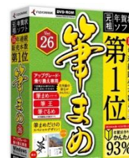
筆まめVer.26 アップグレード・ 乗り換え専用

※1 全国の主要パソコン販売店2,439店（2014年実績）のPOS実売統計 （1999年～2014年・株式会社BCN調べ）