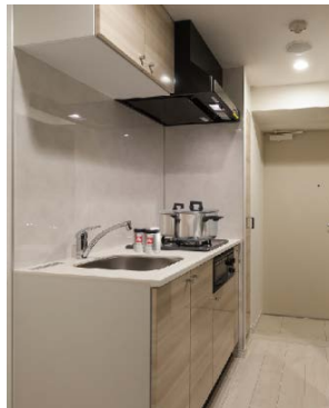
<システムキッチン>