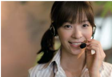
<ガーラコンシェルジュサービスイメージ>