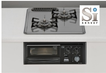
<Siセンサー付2口ガスコンロ>