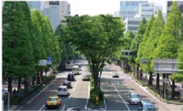
<市役所前の並木道>