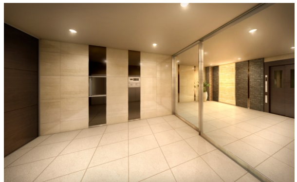
左:外観イメージ、右上:アプローチイメージ、右下:エントランスホールイメージ