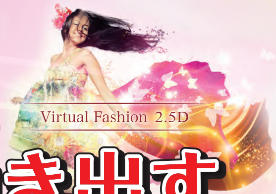
Virtual Fashion 2.5D