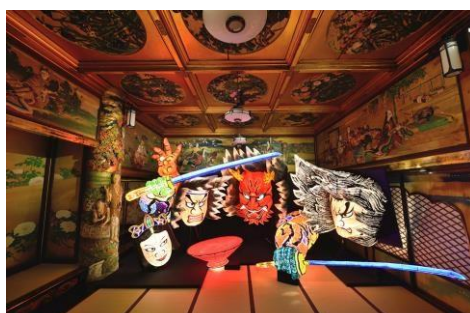
青森ねぶた祭 (漁樵の間)