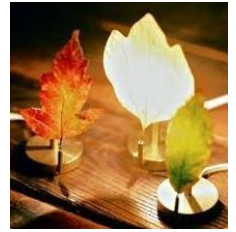
草木のあかりアート