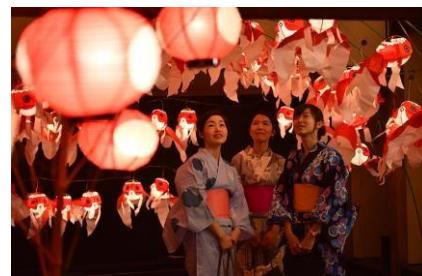
山口県柳井市の金魚ちょうちん