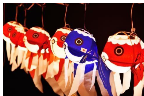
山口県柳井市の金魚ちょうちん (頂上の間)