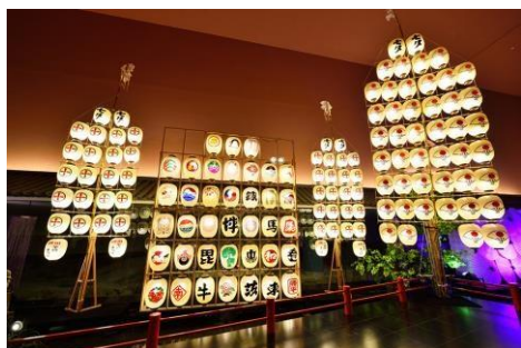
秋田竿燈まつり (パブリックスペース)

目黒雅叙園(運営:株式会社目黒雅叙園/所在地:東京都目黒区)では、2015年7月3日(金)から8月9日(日)まで、「和のあかり×百段階段」展を、園内・東京都指定有形文化財「百段階段」にて開催しております。