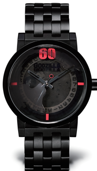
GSX221GDZ SMART no,105 "ゴジラ"

70,200yen (税抜 65,000yen) 2015年8月末発売予定 JANコード 4560147945245 600本限定