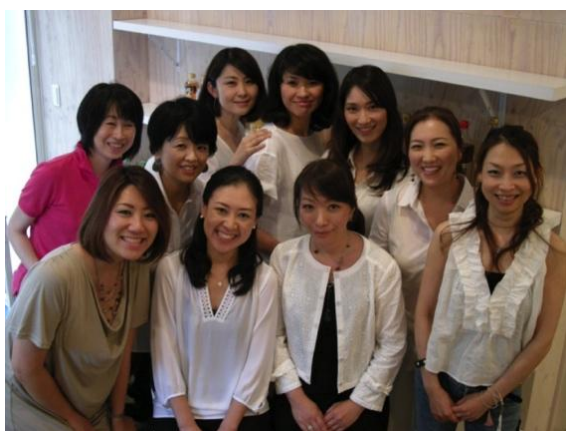
菌美女会メンバー

菌美女会は、美容・健康の観点から「菌活」に注目。菌を含む食品や、菌の恩恵である発酵食品を食べることでより美しく生きることを目指しています。この「花菌活美腸体験ツアー」は、「菌活」の素晴らしさを詰め込んだ、コラボレーションツアーで、菌美女会と「菌活快腸エクササイズ」を考案したビューティオガニストの森和世さん、そして菌活メニューを提供するレストラン(CRECELAならびに炭 bio)の三者合同で企画。ツアーは、金曜日の夕方6時半に恵比寿のスタジオに集合、菌美女会による「菌活」のレクチャー、森和世さんの「菌活快腸エクササイズ」のレッスンを受けて、終了後は、レストランに移動して菌活フルコースを頂くという内容です。