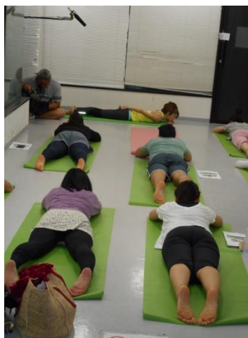
「花菌活美腸体験ツアー」実施風景