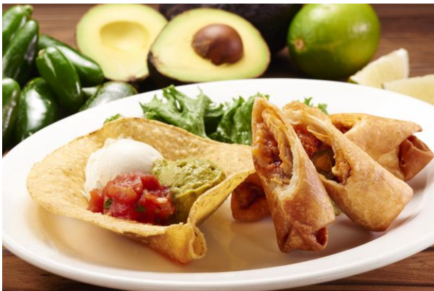
チミチャンガ (780円・税別)

「チミチャンガ」はチリビーンズとチーズが入った、メキシコで人気のあるフライドブリトー。アボカドディップ、サルサソース、サワークリームを付けてお召し上がりください。「チリコンカン」は、メキシコの国境に面したアメリカ・テキサス州の“州の料理”としても有名な一品。メキシコの文化が色濃く残るテキサス州独自の“テクス・メクス料理”のひとつで、ひき肉やキドニービーンズのスパイシーなソースをトルティアチップスでディップしてお楽しみいただけます。