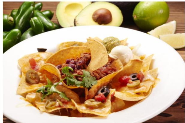
チリコンカン (780円・税別)