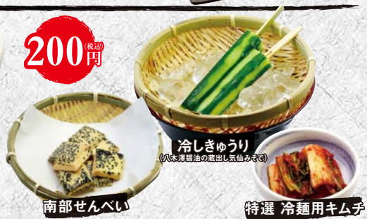
冷しきゅうり (丸太薄醤油の蒸出し気仙めそ)