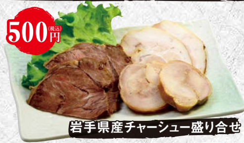
岩手県産チャーシュー盛り合せ