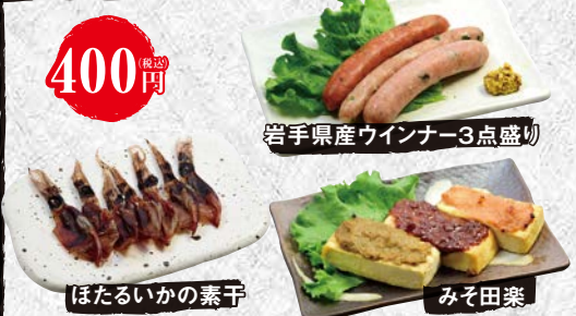
岩手県産ウイナー3点盛り