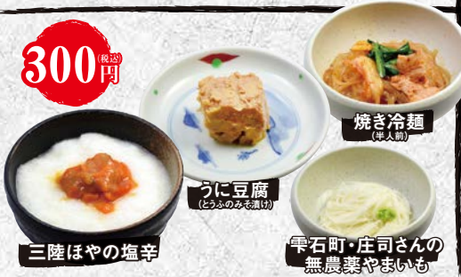
うに豆腐 (とうふのみそ漬)