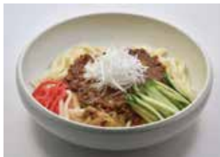
盛岡じゃじゃ麺 (税込 750 円) ※鶏の白湯スープ付き