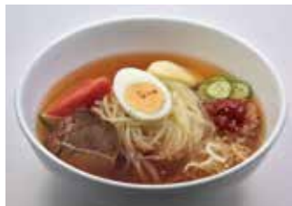
もりおか冷麺 (税込 750 円)