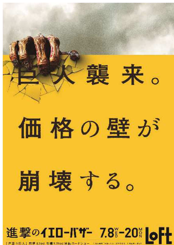
<進撃のイエローバザー キービジュアル>