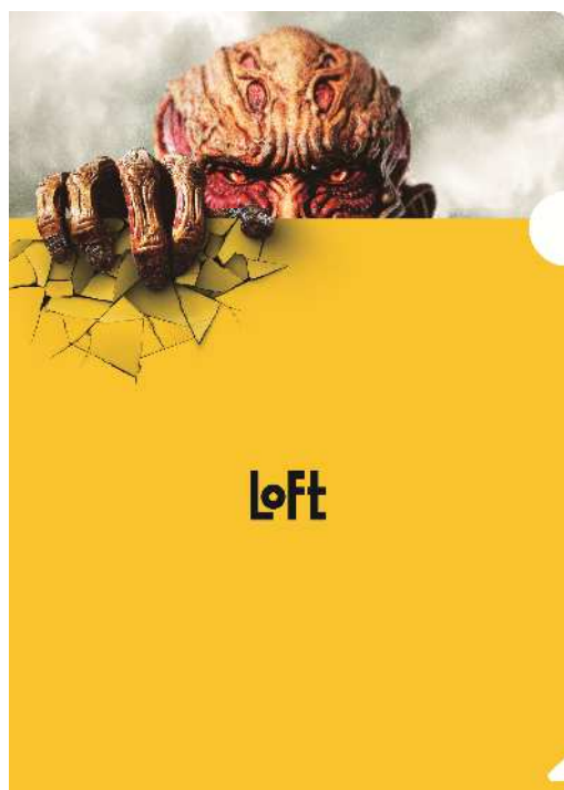
<進撃のイエローバザー クリアファイル>