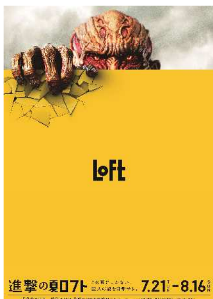
<進撃の夏ロフト キービジュアル>

タイアップキャンペーン第二弾は 2015年7月21日(火)～8月16日(日) の期間で“進撃の夏ロフト”と銘打った店頭キャンペーンを実施いたします。期間中に開催される“進撃の夏ロフト抽選会”では3,000円以上(税込)お買上の方の中から抽選で、Loft限定の実写映画「進撃の巨人」グッズをプレゼントいたします。中でも「立体機動兵賞」に当選した3名様には劇中で使用した立体機動兵の衣装を着て、オリジナル3Dフィギュアを作成することができる権利をプレゼントいたします。他にもLoft限定のノベルティの配布や、Loftで取り扱っている商品を巨人が使用した時の気持ちを綴ったPOPを店舗中に配置し、実写映画「進撃の巨人」の世界をより楽しめる仕様となっております。また渋谷店では、“進撃のイエローバザー”“進撃の夏ロフト”に先んじて2015年7月1日(水)より、“進撃の巨人オリジナルSHOP”がOPENいたします。劇中に使われた立体機動兵の現物衣装や、巨人の特殊マスクが展示され、映画の臨場感を体験することができるようになっております。