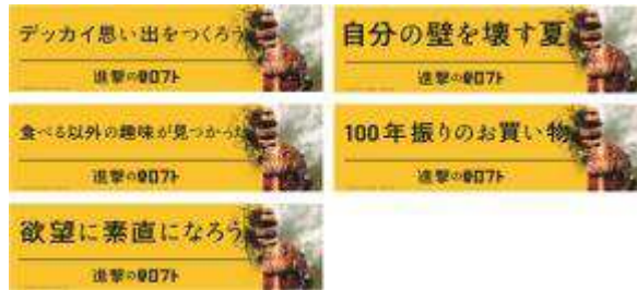
<店内吊り下げ看板>