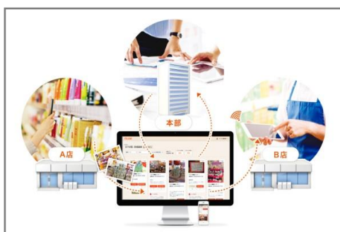
図 3 MiINA(ミーナ)フロー

複数店舗に週単位で変わる売場企画の指示や状況確認がスピーディーにリアルタイムでできます。店舗間でも共有できるので、ノウハウの共有が進みスキルアップに繋がります。