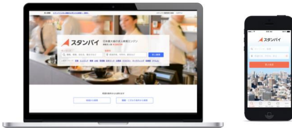
「スタンバイ」Web版とスマートフォン・アプリ版のイメージ

求職者に対しては、求人領域に特化した検索サービスを提供し、「スタンバイ」で作成された求人情報以外にも、国内のインターネット上にあるさまざまな求人情報を集約します。ユーザーは、パソコンやスマートフォンアプリ（iOS版・Android版）を使って、「スタンバイ」上の検索窓に仕事に関するキーワード（業種、職種、会社名、働き方など）と希望の地域（都道府県、市区町村、駅名など）を入力することで求人情報を一括で表示。求職者はいつでもどこでも、簡単かつ効率的に求人情報を検索できます。