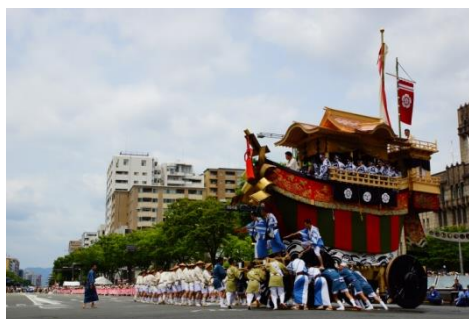
祇園祭の後祭の最後尾を飾る「大船鉾」が京都以外で初めて登場！完成後にはお囃子演奏も行います！