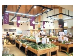
50+会員様限定「京野菜朝市」