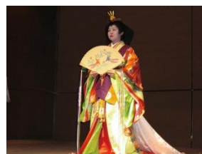
十二単着装パフォーマンス