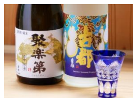
夏の夜に京を味わう 千年の都ダイニング Bar (京都を代表する飲食ブース)