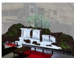
夏を感じる川床カフェ