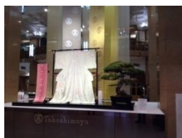
高島屋 きもの特別展示