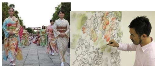
京友禅きものショー&ライブペイント&トークショー