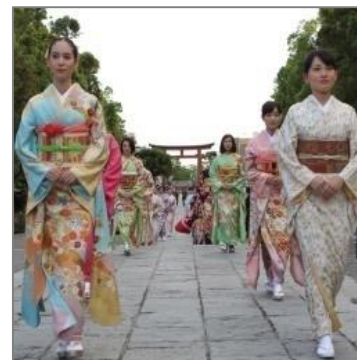
京友禅きものショー