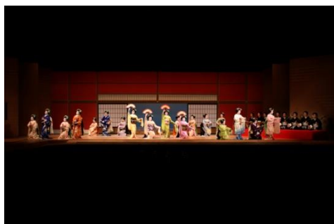
京都の華「芸妓・舞妓」が40名登場！華やかな舞で会場を彩ります！