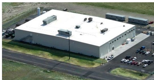
アスタリアルテクノロジーズ工場全景