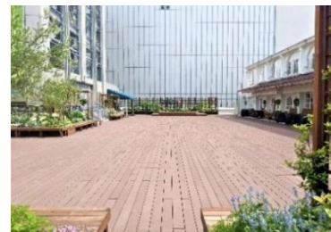
[A 館 3 階屋外スペース「GREENING 広場」]