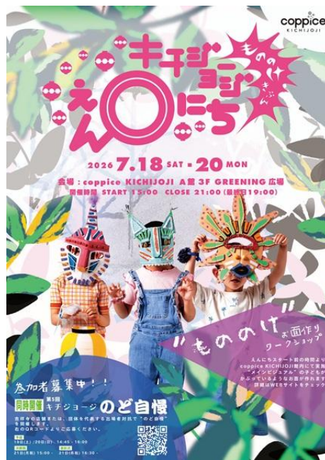
<イベントキービジュアル>

コピス吉祥寺は、本イベントを通じて地域の皆様とともに、3日間「もののけきぶん」で吉祥寺の夏を盛り上げます。