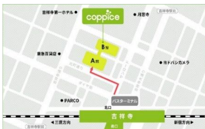
[コピス吉祥寺アクセス MAP]