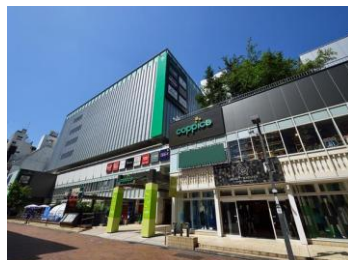
[コピス吉祥寺外観]