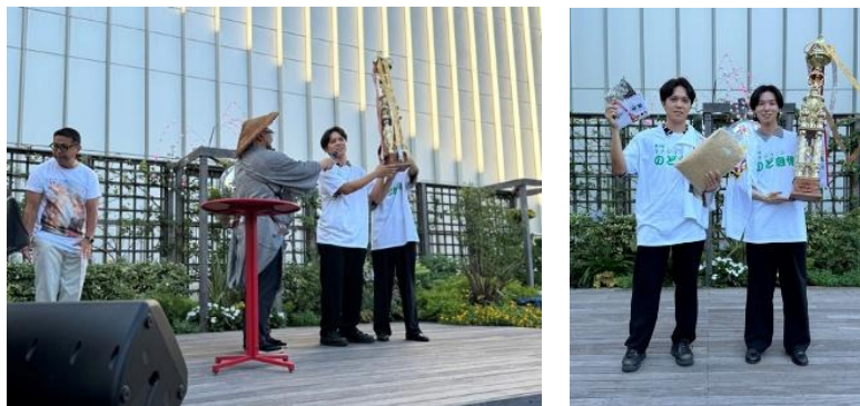
<昨年の優勝者の様子>