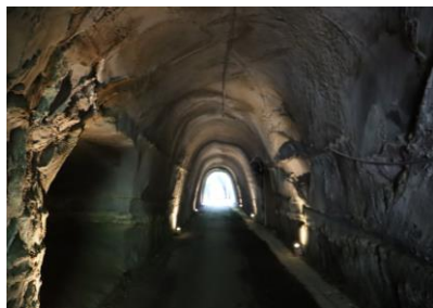
鵜原理想郷入口トンネル