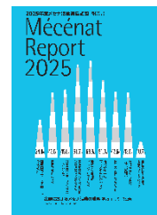
2025 年度 メセナ活動実態調査報告書 「メセナレポート 2025」

前半は、最新の調査結果報告とともに、外部組織と連携して取り組むメセナ活動の具体的な事例について、企業ご担当者様より発表いただきます。後半では、外部連携により広がるメセナの可能性について、モデレーターと事例紹介企業ご担当者様とのディスカッションを通じて、理解を深めていきます。