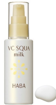
『VCスクワミルク』 3,520円(税込)

『VCスクワミルク』は、スーッと軽やかに肌に伸び広がり、包み込むようにうるおいをキープするミルク状スクワラン。ミルクタイプの化粧品を作るには、乳化剤の助けが必要となりますが、『VCスクワミルク』はビタミンC誘導体であるミリスチル3-グリセリルアスコルビン酸(製品の抗酸化剤)を用いた特殊乳化法により、ハーバー独自の技術で一般的な乳化剤を使用せずにスクワランを乳化しています。保湿力に優れたスクワランと、浸透性に優れたビタミンC誘導体(製品の抗酸化剤)を配合することで、角質層をすみずみまでうるおし、透明感のある肌に導きます。