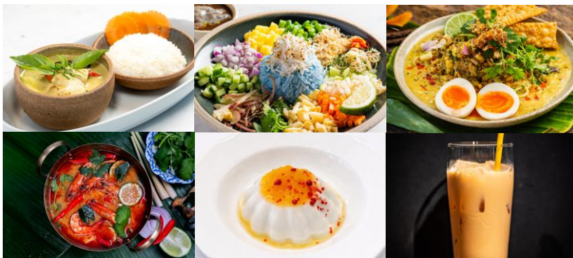
※上段左から①②③、下段左から④⑤⑥

チョンプーでは、スパイスとの相性の良さを活かし、 アーモンドミルクの魅力を取り入れたコラボメニューが登場 します。グリーンカレーやカオソーイ、トムヤムクンなどの 人気メニューにアーモンドミルクを掛け合わせることで、コクがありながらも軽やかな後味に仕上げられています 。ハーブやスパイスの香りを引き立て、これまでにないクリアな味わいを実現。カレーや麺料理、デザートまで幅広く展開され、アーモンドミルクの新たな楽しみ方として広がりが期待されます。