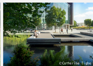
ルリーガーデン (シカゴ・ミレニアムパーク)