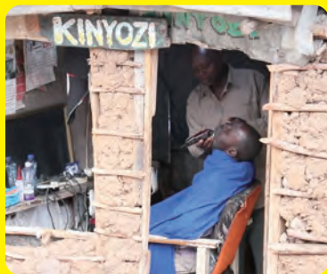
写真展示：Daily Life in Kibera

EXHIBITION @ SHOP 写真や作品展示、ポスター発表、アパレル、グッズ販売など盛りだくさん！