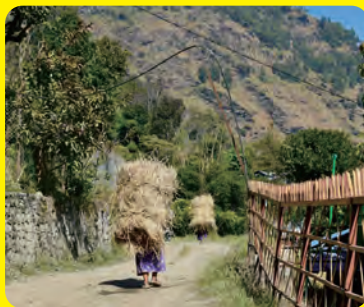
写真展示：ネパールの「はたらく」

2025年に初めてナイロビ、キベラスラムを訪問した日本人中学生の二人がそれぞれの視点からケニアをテーマに作品。